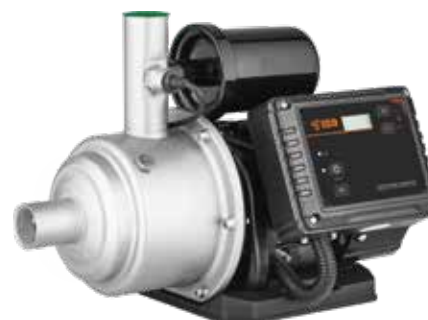
HP INOX AUTO