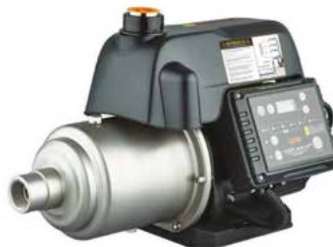
MAGNET AUTO 750