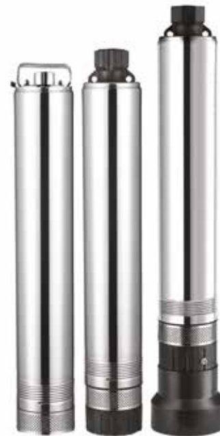
OLA INOX OLA OLA AUTO

Zarówno Ola 60/60 jak i OLA AUTO mogą być zainstalowane w połączeniu ze zbiornikiem hydroforowym, należy jednak pamiętać, że przy montażu pomp z serii OLA AUTO nie ma potrzeby instalacji dodatkowego wyłącznika ciśnieniowego.