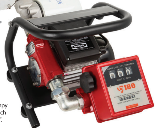
fot. ZESTAW AOP60

Pompy AOP są pompami wodorowymi, łopatkowymi, przeznaczonymi do pompowania oleju napędowego, opałowego i bio-diesla. Pompy zostały wyposażone w zabezpieczenie termiczne, zamontowane w uzwojeniu silnika.