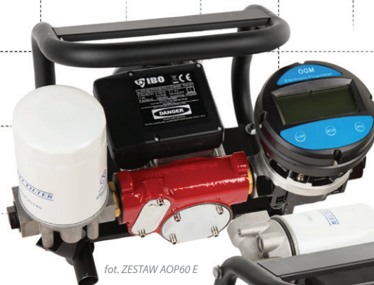
fot. ZESTAW AOP60 E